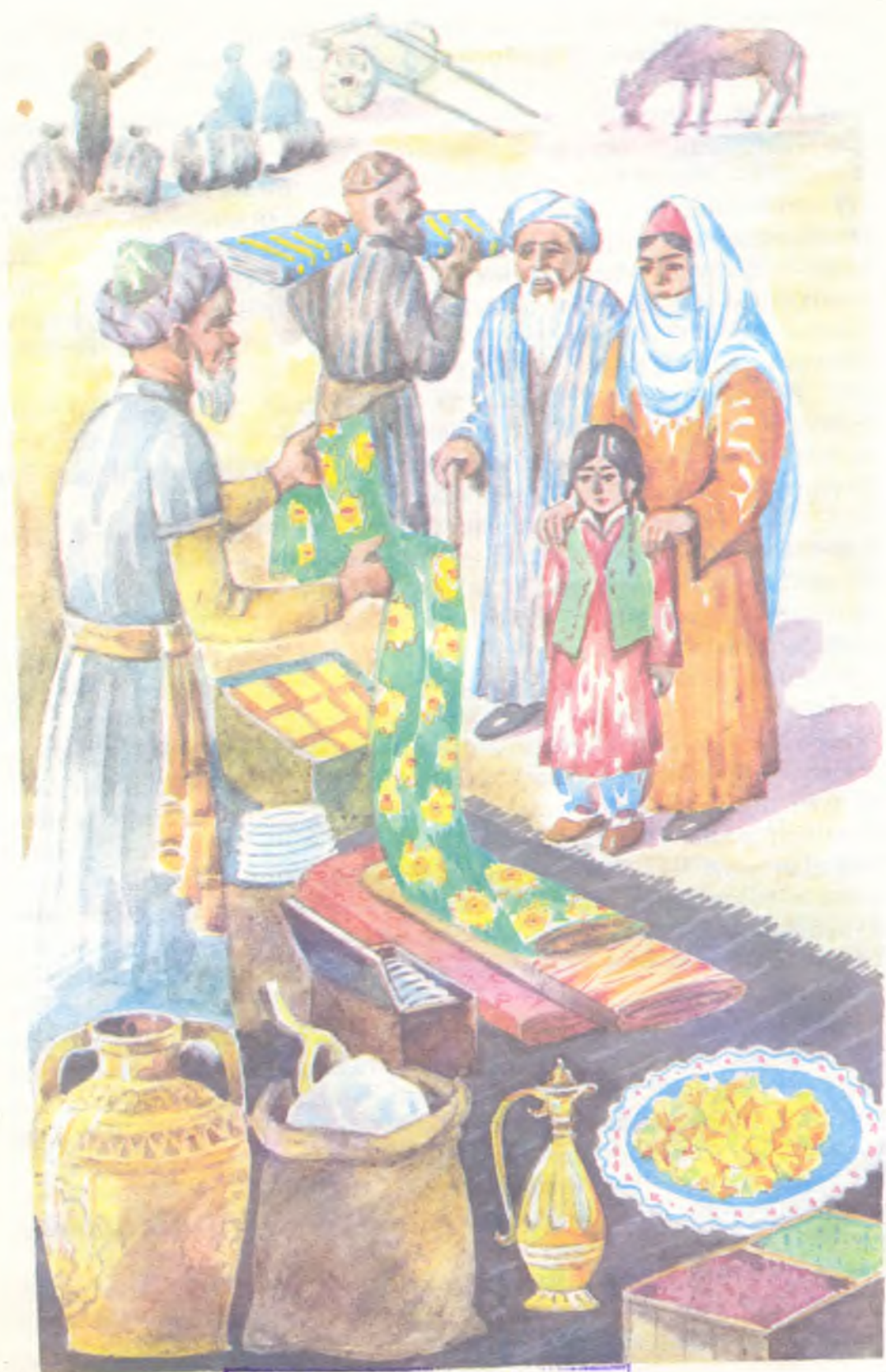
Китобхонаи давлатии Ҷумҳурии Тоҷикистон М. Мисирӣ